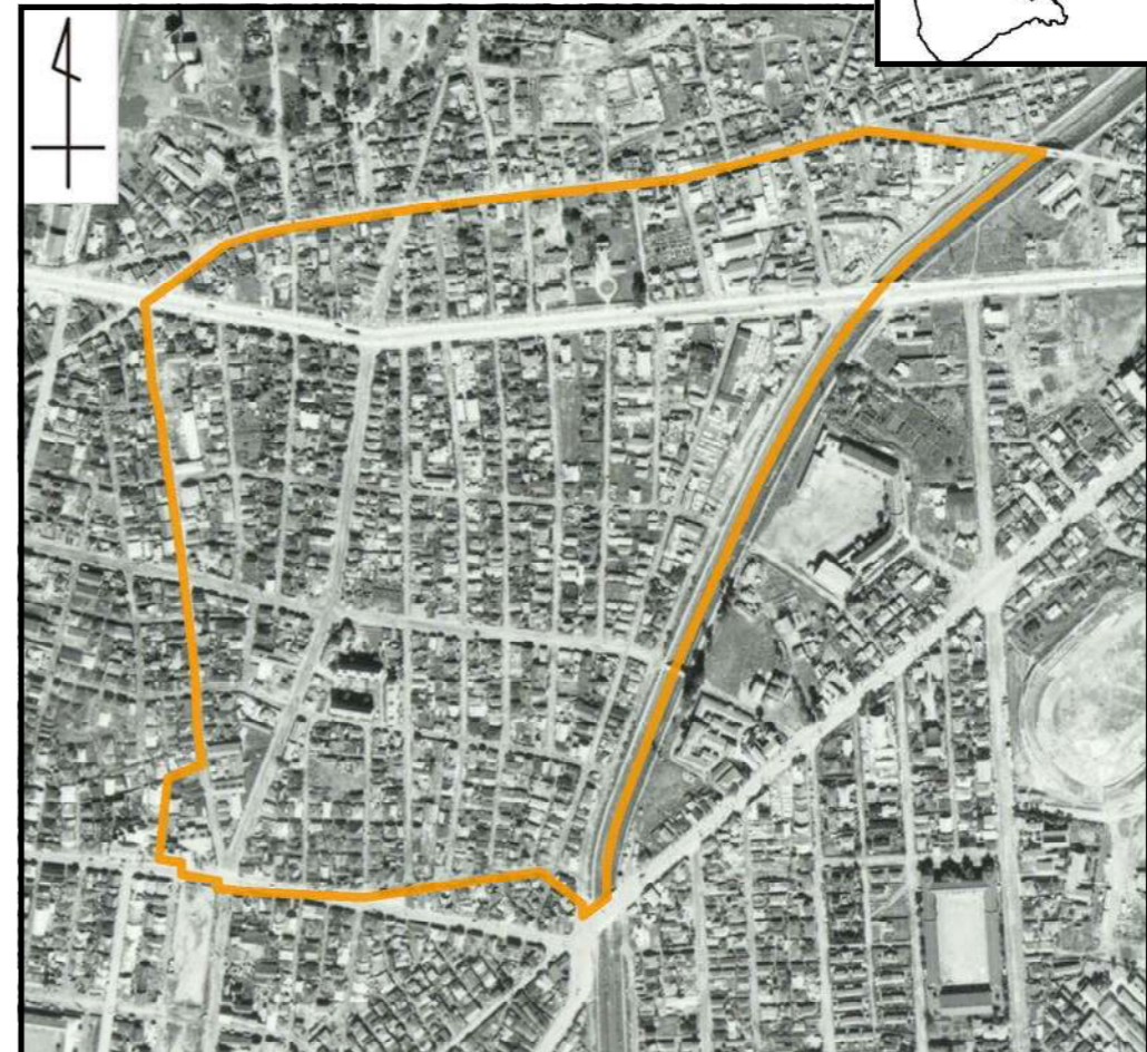
函館第一地区 ～施行後～ (昭和35年撮影)