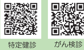
特定健診 がん検診