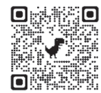
はこだて健康ナビ