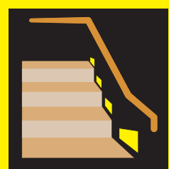
懐中電灯と足元灯とを兼ねて、停電や地震が起きたときに自動的に点灯するタイプが便利です。